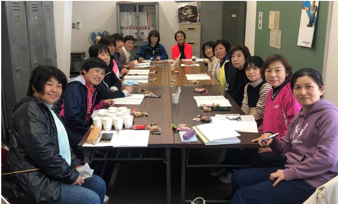
11:30より輝楽会役員会が行われました

3月14日木曜日ホワイトデー、下松市民体育館で輝楽会が行われました。 穏やかな日差しに春を感じる今日、県内各地より43名の参加がありました。